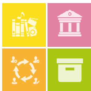
TABLE DES MATIERES